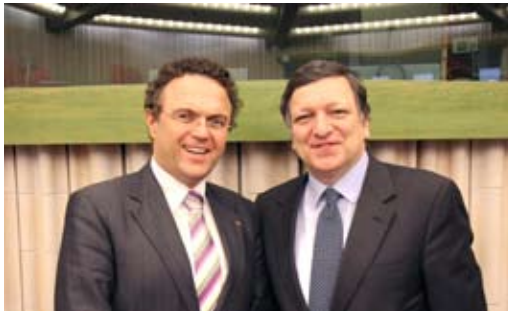
Dr. Hans-Peter Friedrich und der Präsident der Europäischen Kommission, José Manuel Barroso

In Europa müssten die richtigen grundlegenden Weichen gestellt werden, sagte Friedrich. Er sehe gegenwärtig in Europa zwei konkurrierende Grundhaltungen: „Auf der einen Seite stehen die Vertreter eines zentralistischen Ansatzes. Auf der anderen Seite stehen diejenigen, die föderale, subsidiäre Strukturen und mehr Dezentralität wollen.“ Deutschland müsse sich aktiv für ein Europa der Subsidiarität einsetzen. Aus der Vielfalt Europas erwachse dessen Stärke und Innovationskraft. Deshalb begleite die CSU die von der Kommission vorgelegte EU-Strategie 2020, die neue Vergemeinschaftungsmechanismen anstrebt, kritisch-konstruktiv. Große Einigkeit herrschte zwischen Friedrich und den CSU-Europaabgeordneten darin, dass die Ziele der EU auf die Politikbereiche ausgerichtet sein müssten, die in den Regelungskreis der EU fallen. EU-Vorgaben beispielsweise im nationalen Sozial- und Bildungsbereich seien nicht zielführend.