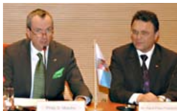
v.l.n.r.: US-Botschafter Phil Murphy und Dr. Hans-Peter Friedrich

lich-liberalen Koalition funktioniere. Bayern nehme in den Beziehungen zu Deutschland eine Sonderrolle ein: Mit keinem anderen Bundesland gebe es so viel wirtschaftlichen und persönlichen Austausch, nirgendwo seien mehr amerikanische Truppen stationiert, so der Botschafter. Während der intensiven Beratungen herrschte zwischen dem Botschafter und der CSU-Landesgruppe große Übereinstimmung darüber, dass sich die bilateralen Beziehungen unter den beiden neuen Regierungen höchst positiv entwickeln. Erst vergangene Woche hatte eine repräsentative Umfrage in den USA ergeben, dass das Ansehen Deutschlands unter Amerikanern ein historisches Hoch erreicht hat.