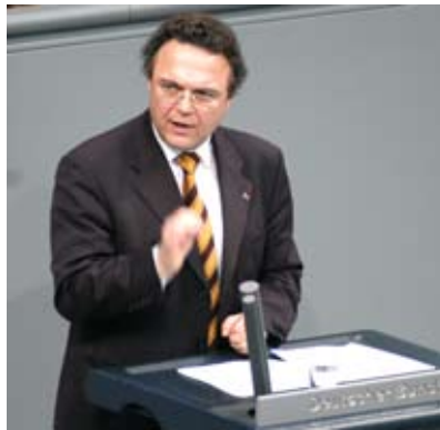
Dr. Hans-Peter Friedrich

der Neuverschuldung um 86 Mrd. Euro vorgesehen war; das ist die Wahrheit. Diese Rekordneuverschuldung ist das Spiegelbild der Krise.