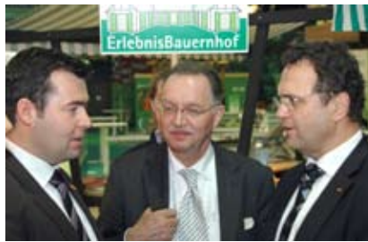
Dr. Hans-Peter Friedrich und Bauernpräsident Gerd Sonnleitner beim gemeinsamen Messerundgang

Exportförderung und Werbung im Inland auf die Beine zu stellen. Dies schließt die Bereitstellung von Haushaltsmitteln ein.