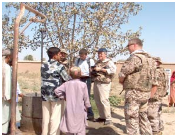
Deutsche Wiederaufbauhilfe: Brunnenbau

künftig vor allem afghanische Sicherheitskräfte ausbilden und den Schutz der Bevölkerung erhöhen. Insgesamt