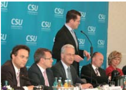
Bundesminister Dr. zu Guttenberg erläutert unsere Politik für das Handwerk

Trotz der aktuellen Opel-Verhandlungen hatte sich auch Bundeswirtschaftsminister Karl-Theodor zu Guttenberg Zeit genommen, um den Teilnehmern die wirtschaftspolitischen Leitlinien der CSU für das Handwerk zu erläutern. Das Handwerk sei das ‚Rückgrat und die Herzkammer‘ der deutschen Wirtschaft, so der Minister.