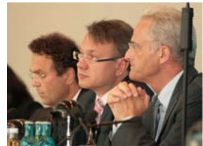
v.r.n.l.: Dr. Peter Ramsauer, Dr. Georg Nüsslein und Dr. Hans-Peter Friedrich

Die rege Beteiligung an der anschließenden Diskussion mit über dreißig Beiträgen machte deutlich, wo dem Handwerk der Schuh drückt. Angesprochen wurden detaillierte Spezialthemen einzelner Handwerksbereiche ebenso wie allgemeine