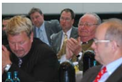
Über 100 Vertreter des Bay. Handwerks folgten der Einladung der CSU-Landesgruppe

Für einen Wahlsieg im September kündigte er weitere Änderungen bei der Unternehmenssteuer an. Bei der Reform der Erbschaftsteuer habe sich